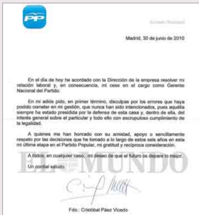
Carta de despedida de Páez a los trabajadores del PP.

> «Disculpas». El gerente se despidió de los trabajadores del PP con una carta fechada el 30 de junio de 2010. Como se puede leer, pide «disculpas» después de una controvertida gestión y, llamativamente, reivindica su «escrupuloso cumplimiento de la legalidad».