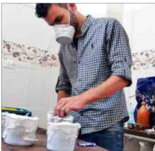
Fábrica de máscaras antigás caseras en Siria.