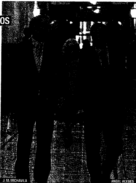
J. M. MICHAVILA

Un bufete en el que trabaja José María Michavila y un constructor que trabajó para Ángel Acebes están contratados por el Ayuntamiento de Boadilla. La empresa de la esposa de Juan Costa obtuvo exenciones fiscales por parte del Consistorio.