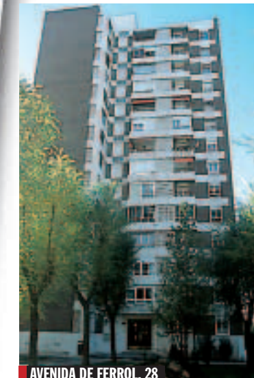
AVENIDA DE FERROL, 28