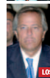
LOS HOMBRES DEL ICO

Moraleja, S.A., y a Inmobiliaria Gordo. Además de comunicarle la resolución del préstamo, se requería a ambas empresas el pago de la totalidad de la deuda en el plazo de un mes, advirtiéndoles de que transcurrido dicho plazo todas las cantidades adeudadas quedaban en situación de vencidas y exigibles.