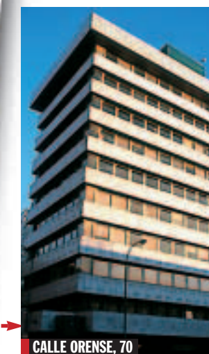
CALLE ORENSE, 70

nar a La Moncloa. El ICO es un organismo que depende orgánicamente del Ministerio de Economía, cuyo titular es el vicepresidente Rodrigo Rato.