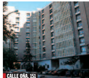
CALLE OÑA, 151

■ Fotocopia de la lista de 45 pisos y 2 garajes, propiedad de Inmobiliaria Gordo, hipotecados por Sanchís para responder de parte del crédito que le concedió el ICO. Todos ellos, salvo una casa en Valencia, están en Madrid. En las fotos, edificios donde se encuentran varios de los inmuebles.