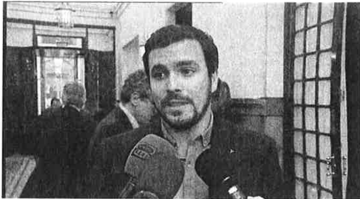
¿Puede un diputado asesorar a una empresa privada?

Archivado en: Vicente Martínez-Pujalte López Federico Trillo Agencia Tributaria Hacienda pública Agencias Estatales Finanzas públicas Administración Estado Administración pública Finanzas