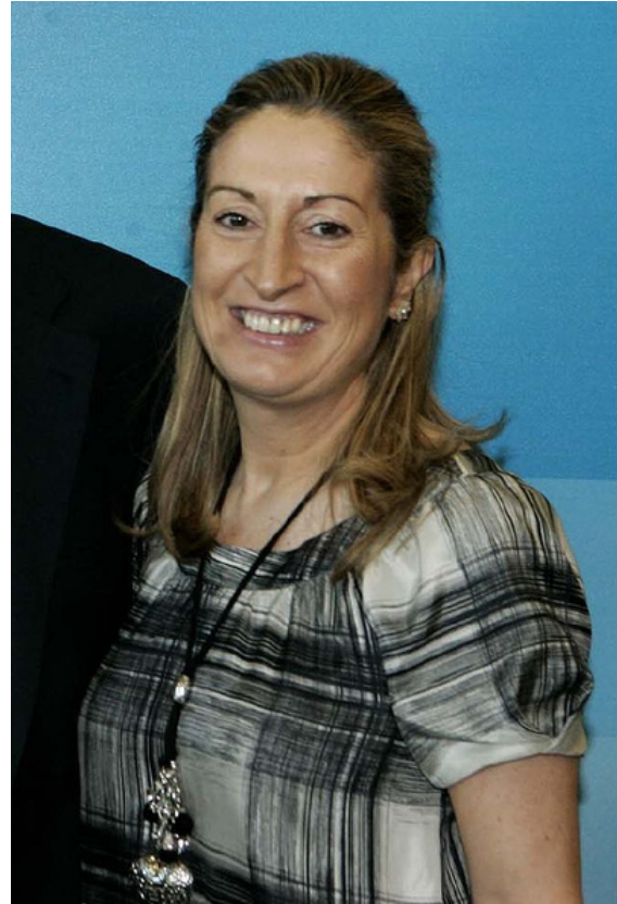
Ana Pastor en 2007

El 22 de diciembre de 2011, fue nombrada ministra de Fomento del Gobierno de España. [4]