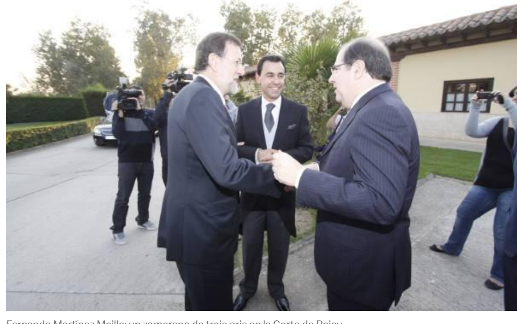
Fernando Martínez Maillo: un zamorano de traje gris en la Corte de Rajoy

Hoy traemos la biografía no oficial ni autorizada del que se dice es el número 3 en el escalafón nacional genoves . De un tiempo a esta parte su cara forma parte de los telediarios de la 1 y se le asocia con el grupo de "jóvenes" que Rajoy digitalmente ha incorporado a su Comité de Dirección y de paso, por razones formales, les ha nombrado Vicesecretarios Generales.