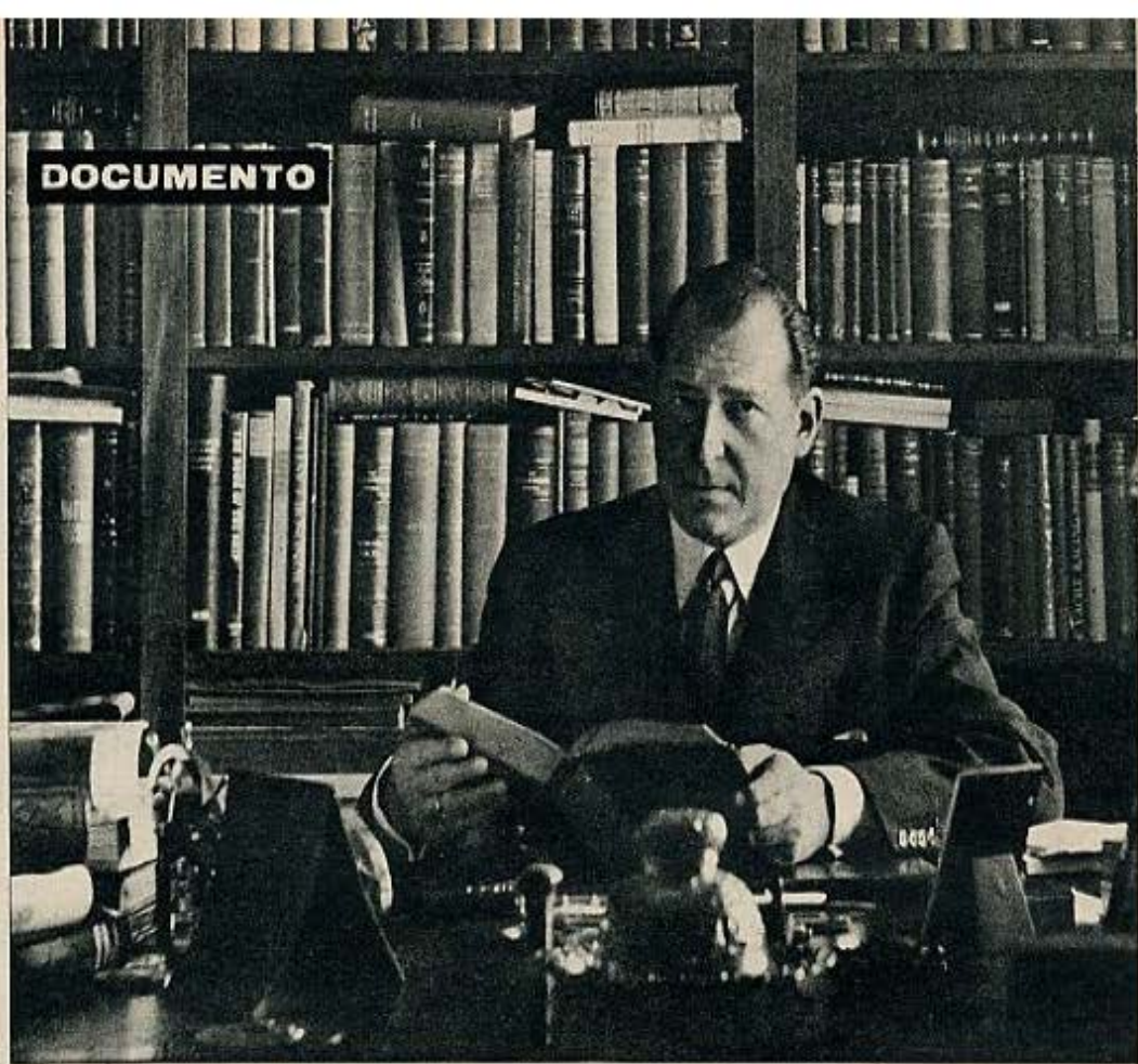
El Conde de Barcelona en su despacho.