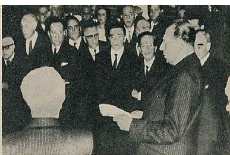
El Conde de Barcelona dirigiéndose a los asistentes a la reunión del 5-III-66.