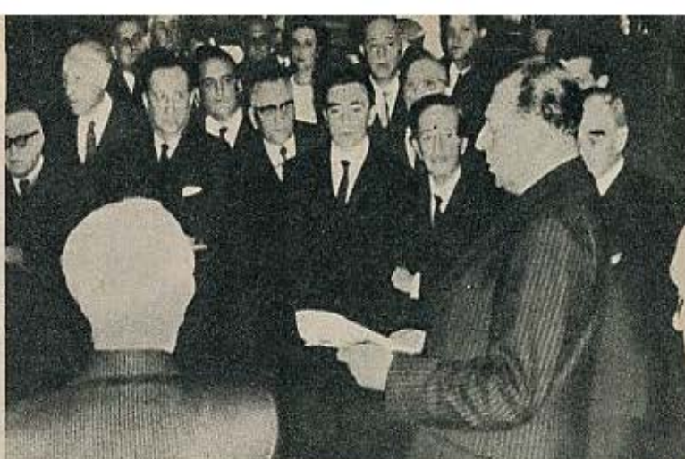
El Conde de Barcelona dirigiéndose a los asistentes a la reunión del 5-III-66.