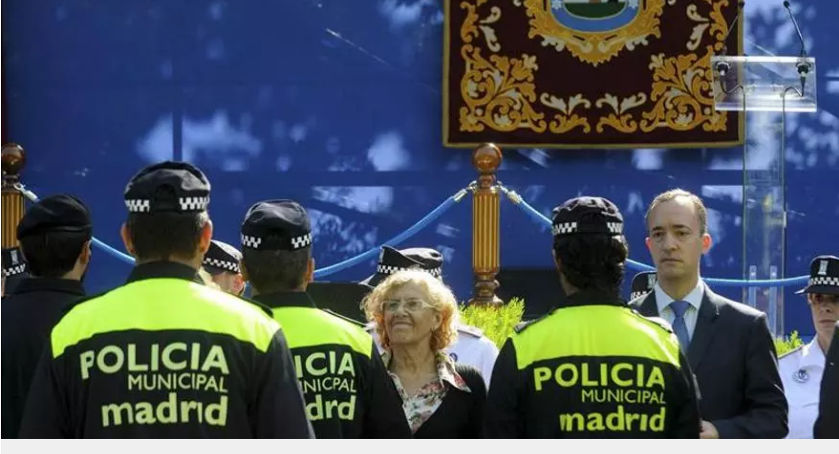
No habrá misa, desfile ni alcohol en el día de la Policía Municipal de Madrid

elDiario.es Madrid 16 de enero de 2019 - 11:36h