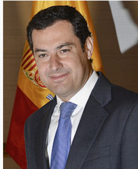
Juan Manuel Moreno Bonilla en 2015