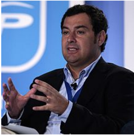
Juanma Moreno en 2012

Tras su nombramiento como secretario de Estado de Servicios Sociales e Igualdad el 30 de diciembre de 2011, impulsó y participó en la redacción de los siguientes planes y leyes: 16