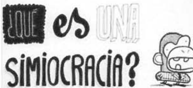
'Simiocracia', una mirada satírica de la crisis