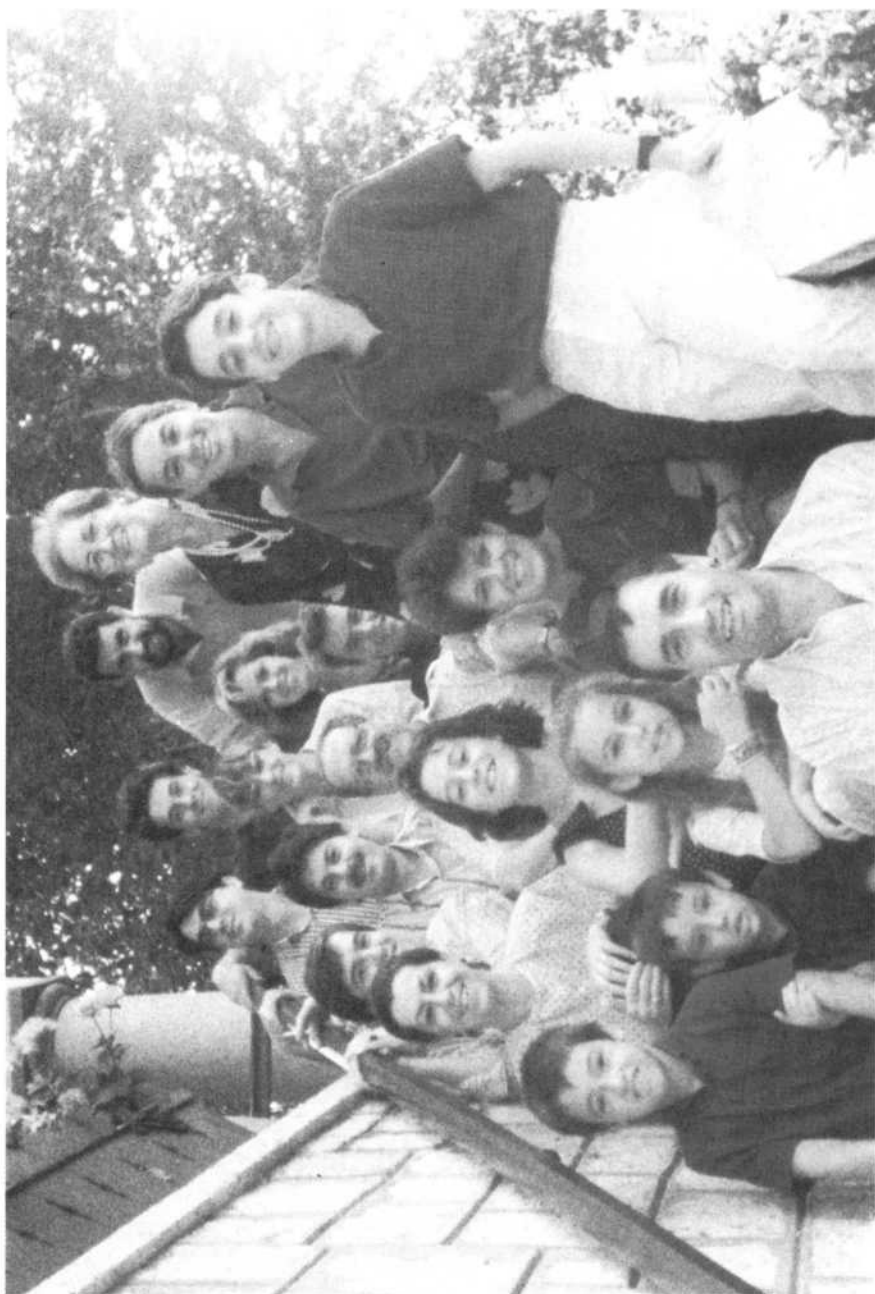
Familia del poeta en 1990.