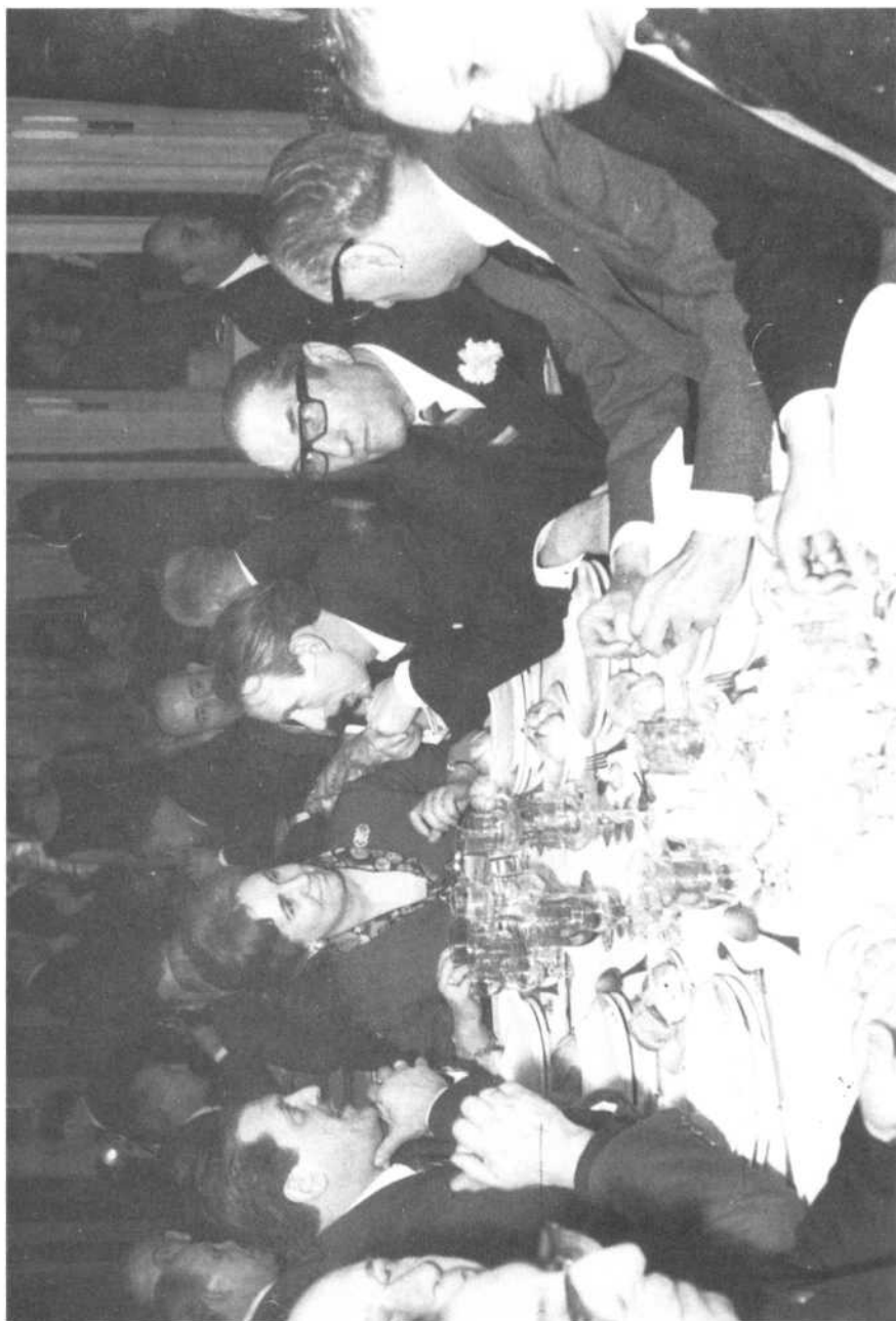
En el homenaje al también poeta y farmacéutico Federico Muelas en 1965.