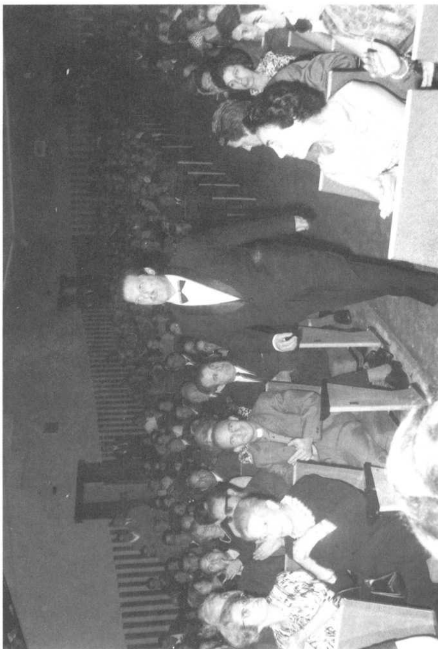
Recibiendo uno de sus numerosos premios poéticos en Sangüesa (Navarra).