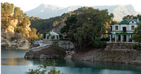
Casa del Ingeniero junto al embalse del Guadalhorce , obra de Rafael Benjumea.

central hidroeléctrica, entre 1903 y 1905, 1 y un pantano —el Pantano del Chorro, más tarde conocido como embalse Conde del Guadalhorce —, inaugurado oficialmente el 21 de mayo de 1921. 1 Aprovechando la visita del monarca Alfonso XIII , Benjumea cambió las antiguas tablas de madera que unían la central y el pantano por una pasarela de cemento que actualmente es conocida como el Caminito del Rey debido a esta visita regia. 2 Todas estas obras en esa región le valieron el título de conde de Guadalhorce, 3 que le fue entregado por Alfonso XIII el 12 de septiembre de 1921. 4