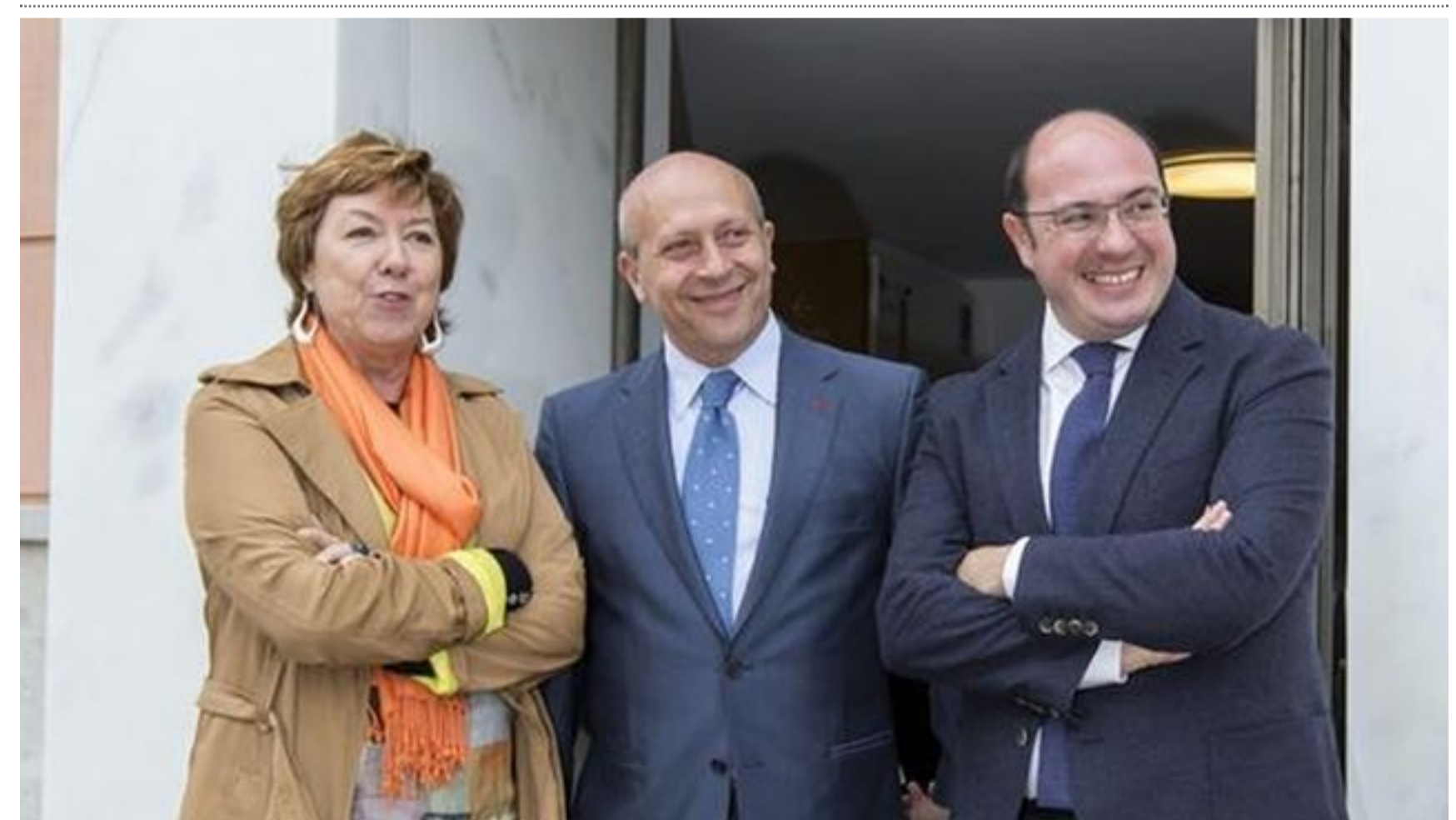
Pilar Barreiro junto a Wert y Pedro Antonio Sánchez

La Fiscalía del Tribunal Supremo ha instado el sobreseimiento de la causa abierta en el Tribunal Supremo contra la diputada nacional y alcaldesa popular de Cartagena, Pilar Barreiro, por la presunta gestión irregular del proyecto urbanístico denominado 'Novo Carthago'. La alcaldesa declaró por estos hechos el pasado 5 de marzo en el alto