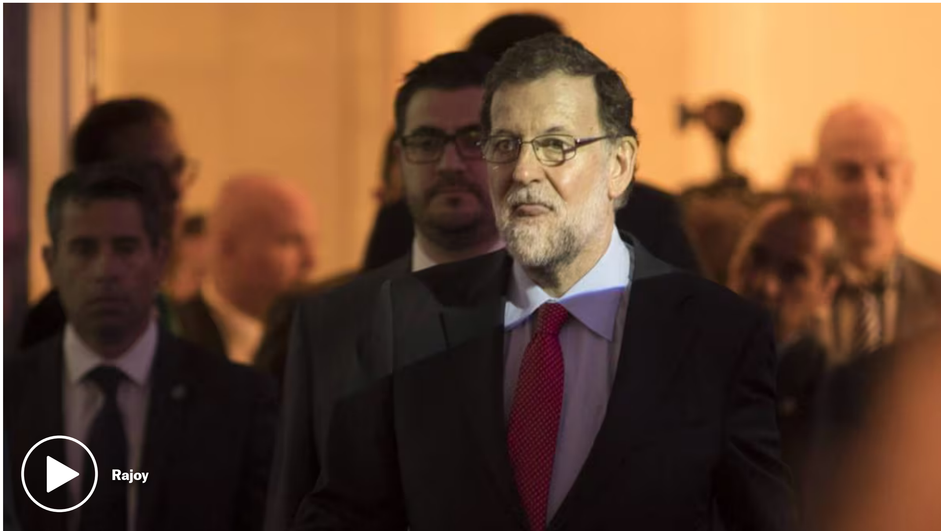
Mariano Rajoy en un encuentro del Círculo de Economía.

El presidente del Gobierno no podrá testificar por videoconferencia y deberá acudir a la sede de la Audiencia Nacional en San Fernando de Henares el 26 de julio