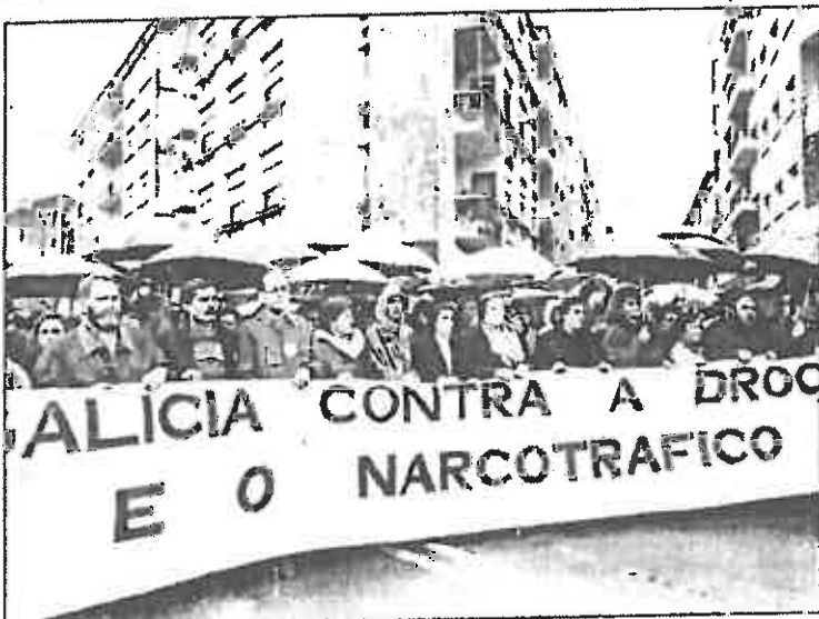
CABEZA DE LA MANIFESTACIÓN DE VILAGARCÍA CONTRA LA DROGA Y EL NARCOTRAFICO