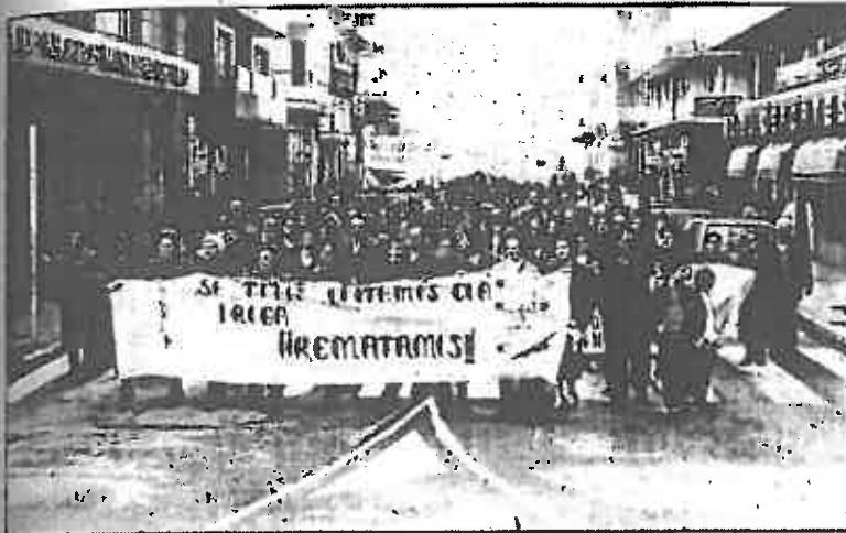
Manifestación de asociaciones antidroga en Vilagarcía de Arousa

Algunos de O Sainés repudiarán el consumo de estupefacientes