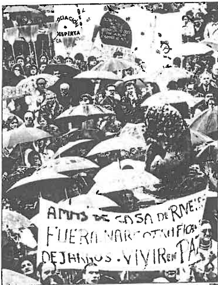
A la marcha acudieron miles de personas de Arousa, Pontevedra, Vigo y numerosas localidades gallegas