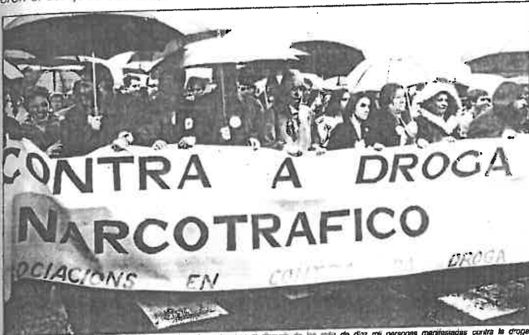
Las paraguas invadieron las calles de Vilagarcía, colapsadas por el discurso de las más de diez mil personas manifestadas contra la droga.

Más de diez mil personas pidieron el cumplimiento íntegro de las condenas y mayor educación en la escuela