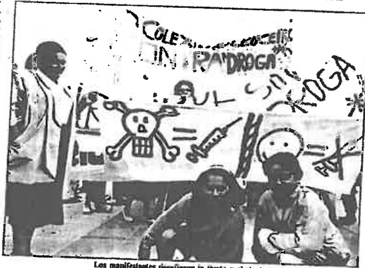
Los manifestantes desfilaron en lluvia y el viento