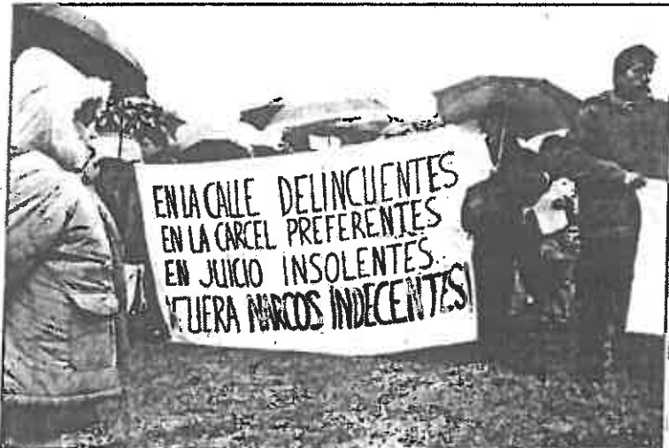
Entre la multitud estaban políticos, centros de enseñanza, asociaciones antídopa y todo tipo de colectivos.

que se la rio de San- Forma, quen nto respo- que traballar, por- quedar nun prescrato. ndo que e to que as oren se que esque e ha ta uná ha da o per- ere po de