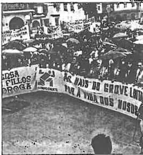
Las señoras de la comarca del Salnés portaron la pancarta que encabezó la gran manifestación. La protesta fue un clamor silencioso contra las drogas