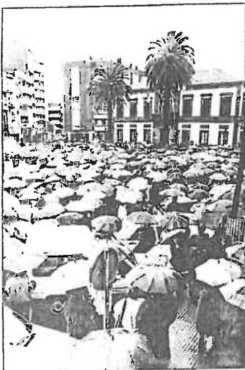
MANIFESTANTES CONCENTRADOS ANTE EL CONSISTORIO N. Santiá

Por otro lado, Avendaño y el gobernador civil de Pontevedra, Jorge Parada, homenajeados también, no se andaron con remilgos a la hora de referirse a los narcotraficantes. "Son sólo unos pocos y además los despreciamos", señaló la presidenta de la Federación de Asociaciones de Lucha contra la Droga de Galicia, que pidió "que los detengan y les incauten sus propiedades". De "pandilla de sinvergüenzas y delincentes", los calificó Parada, que, por el contrario, alabó que la ciudadanía haya evolucionado de cierta permisividad a la condena.