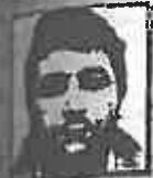
Laureano Oubiña «Capo» por tráfico de drogas. Uno de los principales del tráfico de drogas gallego.

Estos son los principales «capos» detenidos que controlan el tráfico de drogas y tabaco en la Ría de Arosa.