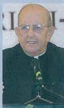
Marcial Maciel, fundador

sa unas pérdidas de 607.000 euros. La fundación Iuve, en la órbita de los Legionarios pero autónoma, se gastó en el último ejercicio 2,3 millones de euros en ayuda al Tercer Mundo. La gestión se rige "por el principio de autofinanciación y la gestión exigente" y se financia a través de donativos,