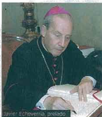
Javier Echeverría, prelado

asignación tributaria del IRPF ahora que no cuenta con la garantía de unos ingresos mínimos que le ofrecía el Estado. Los obispos han comenzado este año temprano y ya tienen en marcha una campaña para conseguir que aquellos que no están obligados a hacer la declaración y solicitan ya la devolución, hagan uso del formulario que les permite destinar la asignación tributaria a la Iglesia católica.