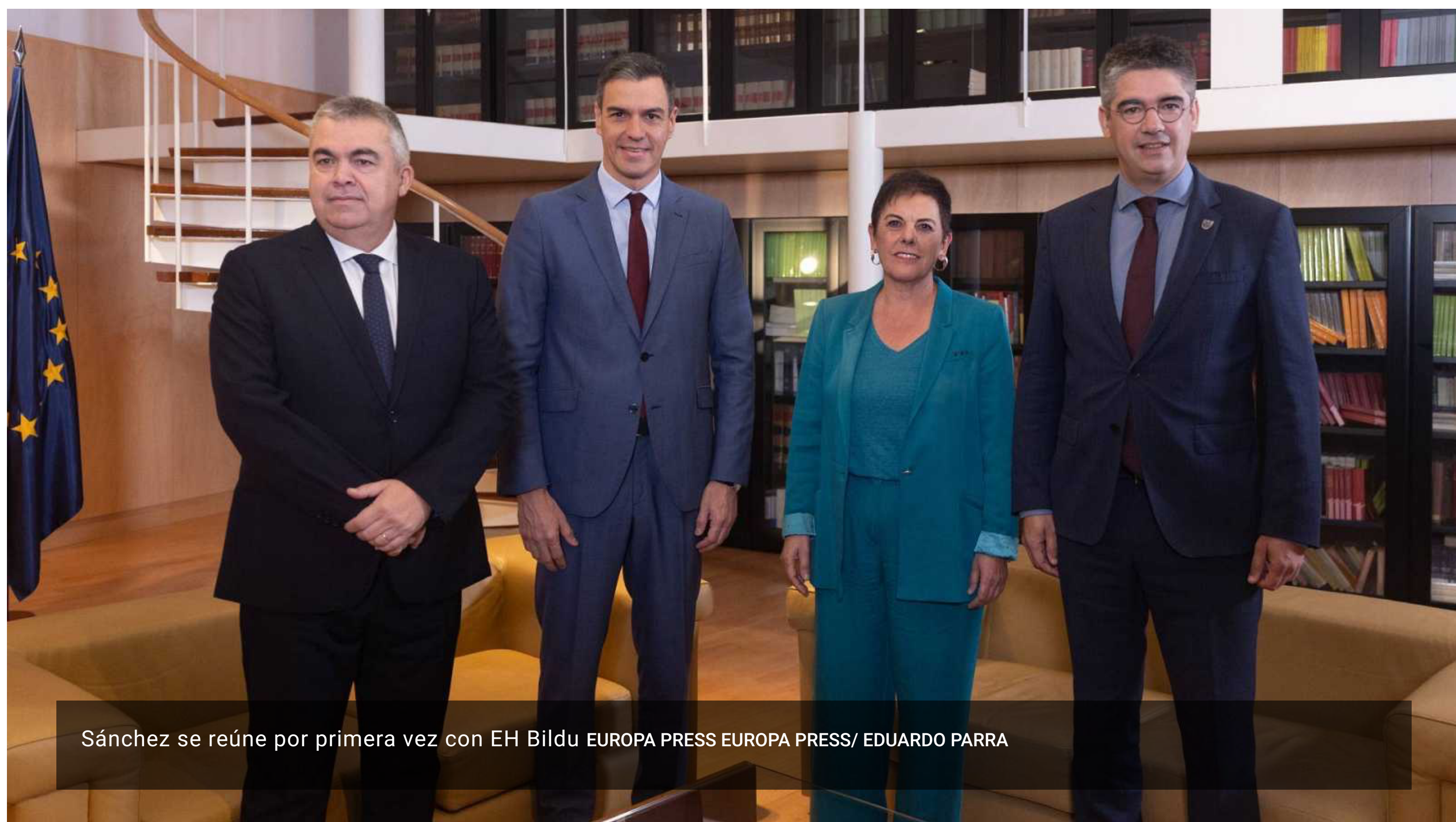
Sánchez se reúne por primera vez con EH Bildu

13.10.2023 | 11:40 horas Por MARÍA MENÉNDEZ