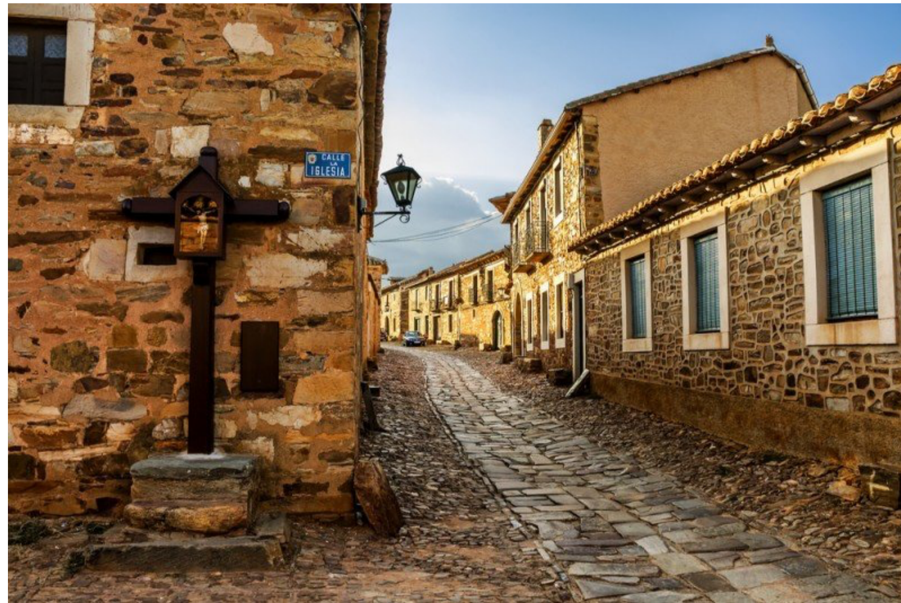
Los alojamientos de presentan un aumento anual de las pernoctaciones del 23,4% en marzo, con un incremento del 29,6% en las de residentes.

Las pernoctaciones de no residentes en apartamentos turísticos representan el 84,4% del total. El Reino Unido es el principal mercado emisor; con más de un millón de pernoctaciones, un 1,4% menos que un año antes; seguido de Alemania , con 556.448 estancias, un 6,6% menos.