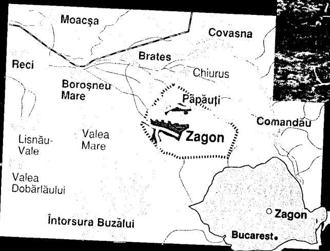
■ Arriba, un paraje de la zona elegida por el ministro Álvarez-Cascos para cazar urogallos. A la izquierda, detalle de la región en un mapa de Rumanía.