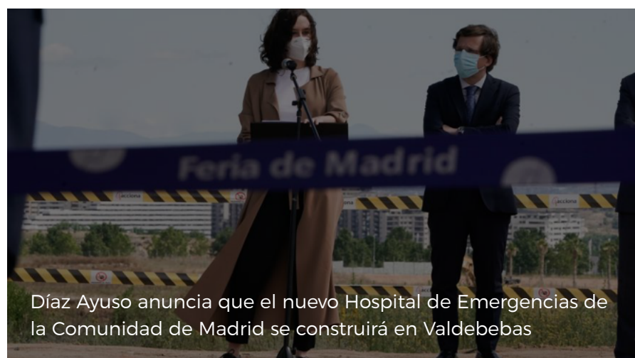
Díaz Ayuso anuncia que el nuevo Hospital de Emergencias de la Comunidad de Madrid se construirá en Valdebebas