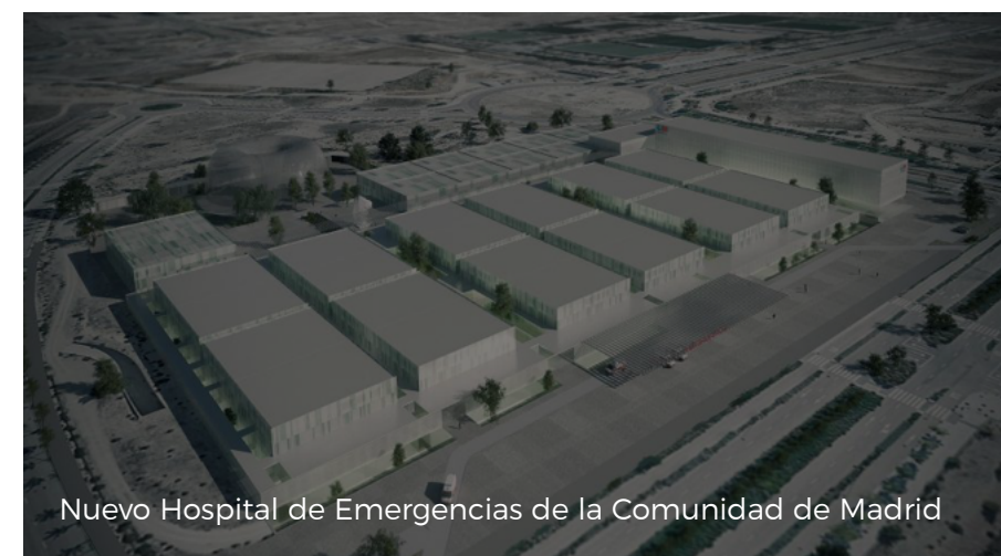
Nuevo Hospital de Emergencias de la Comunidad de Madrid

( https://www.comunidad.madrid/sites/default/files/styles/colorbox_modal/public/img/instalaciones/hospital_4.jpg?itok=K-bmEwEr )