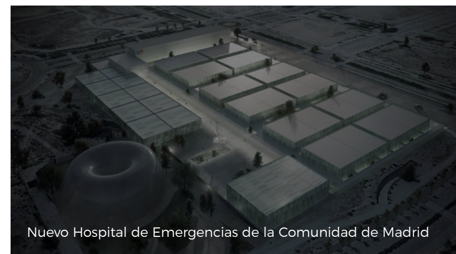
Nuevo Hospital de Emergencias de la Comunidad de Madrid

( https://www.comunidad.madrid/sites/default/files/styles/colorbox_modal/public/img/instalaciones/hospital_1.jpg?itok=AgtAYPh_ )