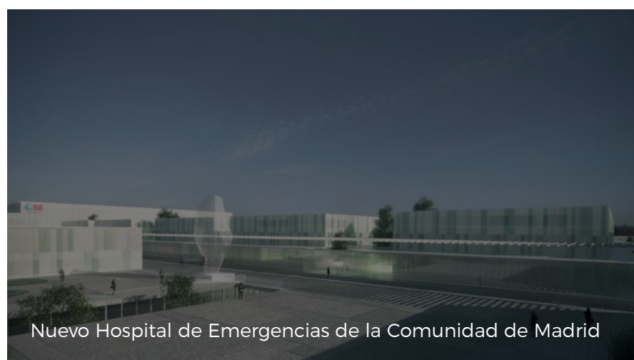
Nuevo Hospital de Emergencias de la Comunidad de Madrid

( https://www.comunidad.madrid/sites/default/files/styles/colorbox_modal/public/img/instalaciones/hospital_3.jpg?itok=dr7Yuood )