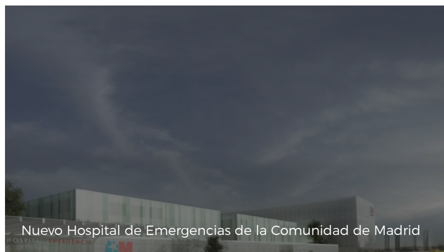
Nuevo Hospital de Emergencias de la Comunidad de Madrid

( https://www.comunidad.madrid/sites/default/files/styles/colorbox_modal/public/img/instalaciones/hospital_1.jpg?itok=AgtAYPh_ )