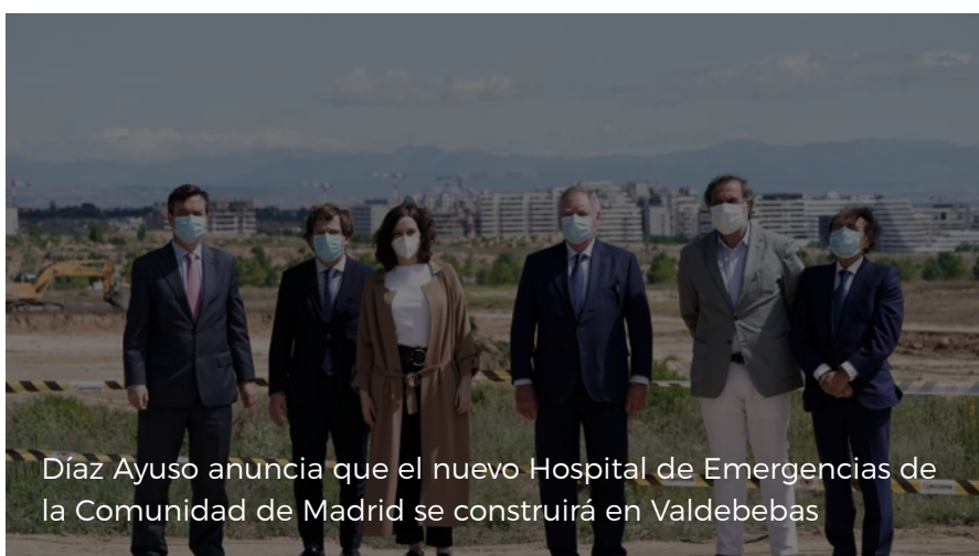
Díaz Ayuso anuncia que el nuevo Hospital de Emergencias de la Comunidad de Madrid se construirá en Valdebebas