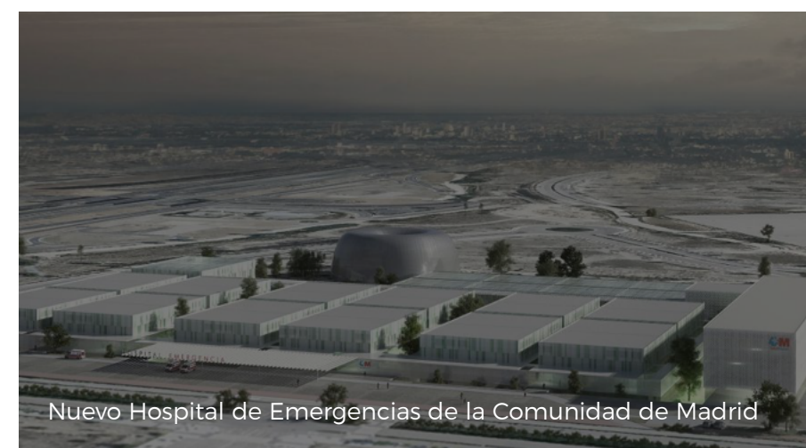
Nuevo Hospital de Emergencias de la Comunidad de Madrid

( https://www.comunidad.madrid/sites/default/files/styles/colorbox_modal/public/img/instalaciones/hospital_2.jpg?itok=xYOIm7Bz )