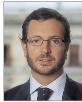
Javier Maroto Aranzábal PP