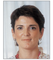
Beatriz Artolazabal Albéniz EAJ-PNV/EA