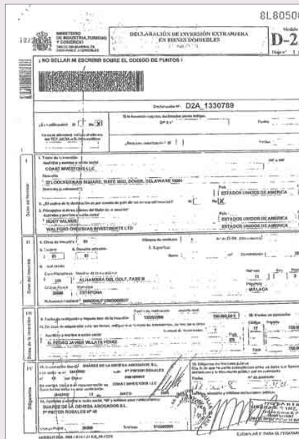
Declaración oficial de Coast Investors admitiendo que es propiedad de Waldorf Overseas Investments.