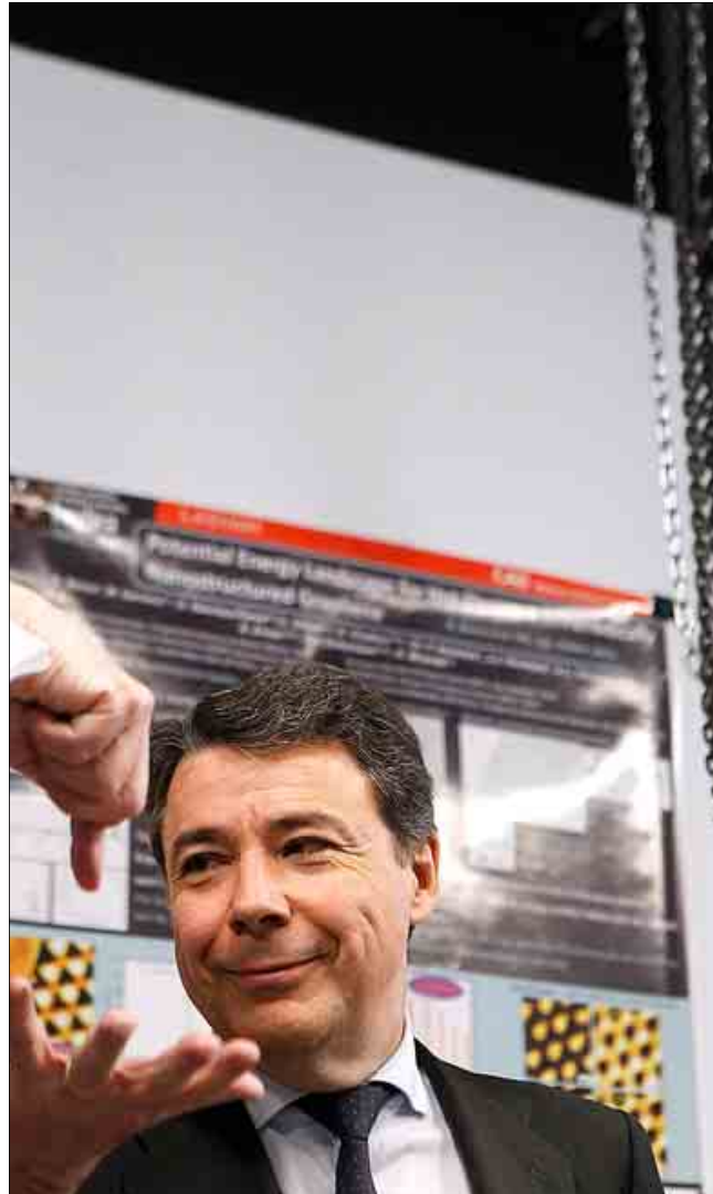
El presidente de la Comunidad de Madrid, Ignacio González, ayer.

El secretario general de los socialistas madrileños, Tomás Gómez, consideró ayer que González ya es-