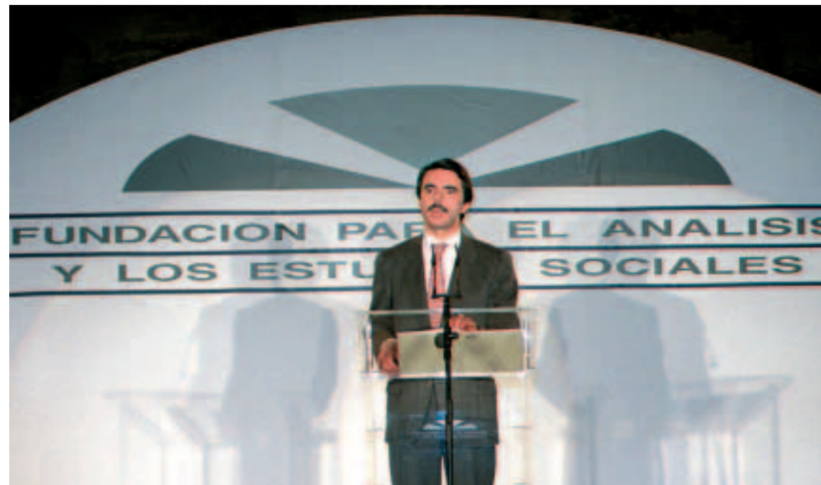
■ José María Aznar, durante un acto de la FAES celebrado en febrero de 1996, semanas antes de las elecciones generales que otorgaron el primer triunfo al Partido Popular.

aportó 6,4 millones de euros (16 por ciento del total), mientras que Trabajo y Ciencia y Tecnología otorgaron cantidades simbólicas cuya suma no llega al uno por ciento del total.