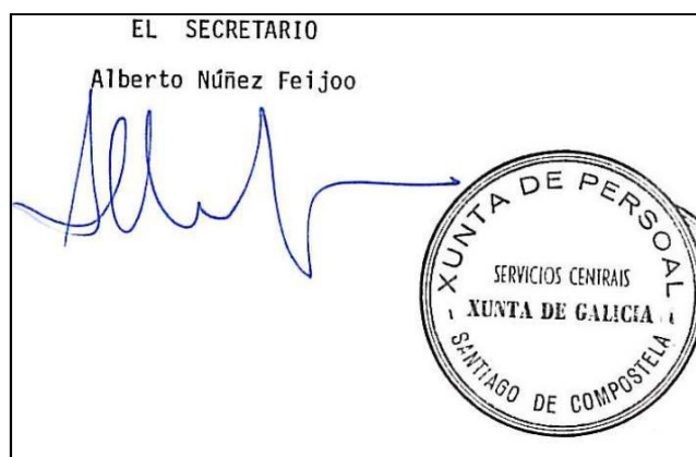
Acta núm. 1 da Xunta de Persoal SSCC (28-01-1988)

Até aquí chegou a romaría. Nas seguintes eleccións sindicais A.F.I.C.A. xa nin se presentou. A maioría dos integrantes da súa candidatura nas anteriores eleccións pasaron posteriormente a ser funcionarios de carreira.